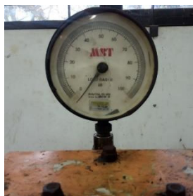
Gambar 3. Dial Gauge CTM ( Compression Testing Machines )

Menyesuaikan bentuk dan ukuran drat ulir pada alat dan pada Pressure Transmitter , sehingga sensor Pressure Transmitter bisa dihubungkan dengan jalur pipa olie hidraulik untuk memberi tekanan dan berfungsi sebagai pengukur pembacaan nilai hasil uji bahan yang ditekan.