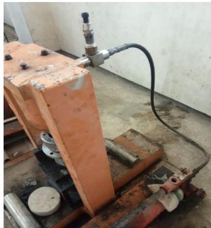
Gambar 10. Sensor Pressure Transmitter 100 Bar yang terhubung ke alat CTM ( Compression Testing Machines )