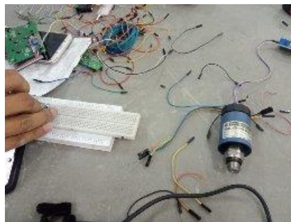
Gambar 5. Sensor Pressure Transmitter

“Pada bagian perangkat pressure transmitter, terdapat tiga jenis sensing element yang terpasang pada masing-masing Pressure transmitter yaitu: Capacitance, Piezoresistive, dan Extensi-metric. Sinyal output dari masing-masing pressure transmitter berupa tegangan (0–10) Vdc. Sinyal output tersebut diteruskan ke PLC CP1H sebagai perangkat pengolah data”.(Gozali et al., 2023)