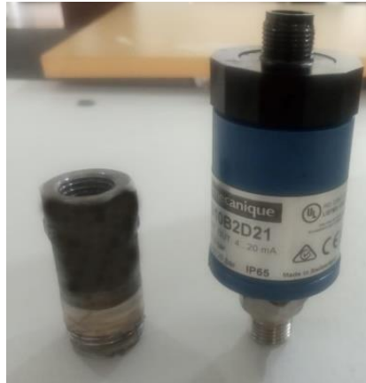
Gambar 7. Interface penghubung dan Sensor Pressure Transmitter

Setelah ukuran pipa drat penghubung dari alat CTM ( Compression Testing Machines ) dengan pipa drat sensor Pressure Transmitter sudah sesuai, kemudian kedua alat tersebut dipasang dan saling terhubung dengan kondisi yang kuat dan rapat menggunakan kunci pas, supaya olie hidroulik yang tertekan tidak keluar melalui sambungan interface penghubung. Langkah berikutnya adalah melakukan konfigurasi seting pengukuran pada sensor Pressure Transmitter , dilakukan identifikasi fungsi dan kinerja alat sensor Pressure Transmitter , setelah pada tahapan ini indikasi alat sensor Pressure Transmitter bisa bekerja dan berfungsi, kemudian alat sensor Pressure Transmitter dihubungkan pada rangkaian elektronik Pembaca hasil ukur secara digital dengan sambungan konektor kabel listrik.