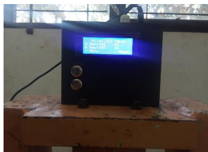
Gambar 11. Sensor Pressure Transmitter 100 Bar yang terhubung ke alat CTM ( Compression Testing Machines )

Dalam tahapan Gambar 10 dilakukan proses menghubungkan alat sensor Pressure Transmitter dengan rangkaian elektronik Pembaca hasil ukur secara digital menggunakan sambungan konektor kabel listrik.