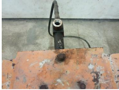
Gambar 4. Pipa Drat CTM ( Compression Testing Machines )