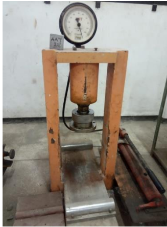
Gambar 2. CTM ( Compression Testing Machines ) Analogue

verifikasi, didapatkan informasi riil alat uji kuat tekan beton dalam kondisi awal model alat kuat tekan beton sebelum dilakukan modifikasi seperti Gambar 2