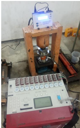
Gambar 16. Proses pengujian bahan uji untuk kalibrasi turunan Compression Testing Machines (CTM) dengan Load Cell dan Data logger

Pada proses pengujian ini peralatan Compression Testing Machines (CTM) yang sudah dimodifikasi secara digital digunakan untuk menguji Load Cell yang sudah terkalibrasi. Nilai ukur hasil uji load cell yang terbaca melalui alat Compression Testing Machines (CTM) digital dibandingkan dengan nilai ukur hasil uji load cell yang terbaca melalui data logger . Perbandingan dilakukan mulai dari interval nilai load cell pada pembacaan data logger 10 kN, 15 kN, 20 kN, 25 kN, 30 kN, 35 kN, 40 kN, 45 kN, 50 kN, sehingga didapatkan nilai hasil ukur peralatan Compression Testing Machines (CTM) yang sudah dimodifikasi secara digital menjadi akurat.