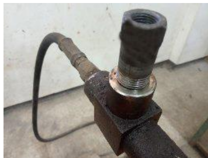
Gambar 6. Interface penghubung yang menempel Pipa Drat CTM ( Compression Testing Machines )

Pengecekan sedetil mungkin kesesuaian ukuran sock drat yang dibutuhkan untuk menghindari terjadinya kesalahan dan kerusakan alat