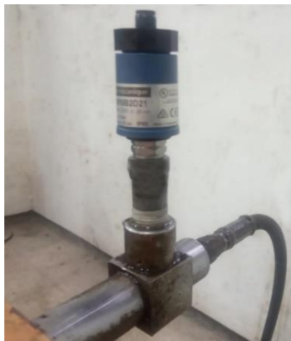
Gambar 8. Sensor Pressure Transmitter yang terhubung ke alat CTM ( Compression Testing Machines )

Setelah ukuran pipa drat penghubung dari alat CTM ( Compression Testing Machines ) dengan pipa drat sensor Pressure Transmitter sudah sesuai, kemudian kedua alat tersebut dipasang dan saling terhubung dengan kondisi yang kuat dan rapat menggunakan kunci pas, supaya olie hidroulik yang tertekan tidak keluar melalui sambungan interface penghubung. Langkah berikutnya adalah melakukan konfigurasi seting pengukuran pada sensor Pressure Transmitter , dilakukan identifikasi fungsi dan kinerja alat sensor Pressure Transmitter , setelah pada tahapan ini indikasi alat sensor Pressure Transmitter bisa bekerja dan berfungsi, kemudian alat sensor Pressure Transmitter dihubungkan pada rangkaian elektronik Pembaca hasil ukur secara digital dengan sambungan konektor kabel listrik.