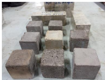
Gambar 13. Bahan uji untuk kalibrasi turunan mesin Compression Testing Machines (CTM) dan Universal Testing machine (UTM)

Langkah selanjutnya membuat pemodelan bahan uji sejumlah 30 pcs, dengan rincian 10 bahan uji dengan nilai ukur 25 kN, 10 bahan uji dengan nilai ukur 50 kN, 10 bahan uji dengan nilai ukur 75 kN.