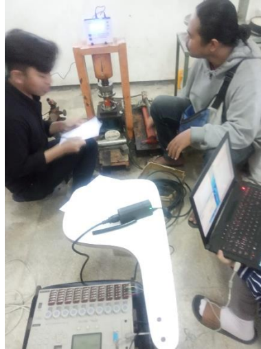
Gambar 17. Proses pengujian bahan uji untuk kalibrasi turunan Compression Testing Machines (CTM) dengan Load Cell dan Data logger .