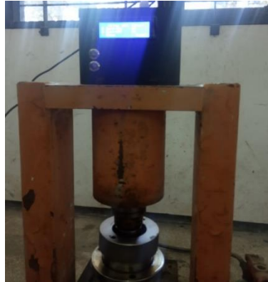
Gambar 12. Sensor Pressure Transmitter 100 Bar yang terhubung ke alat CTM ( Compression Testing Machines )

Pada tahapan Gambar 12 alat uji kuat tekan beton modifikasi ini digunakan untuk menguji bahan uji, alat sensor Pressure Transmitter dengan rangkaian elektronik Pembaca hasil ukur secara digital menggunakan sambungan konektor kabel listrik bekerja dan berfungsi dengan baik.