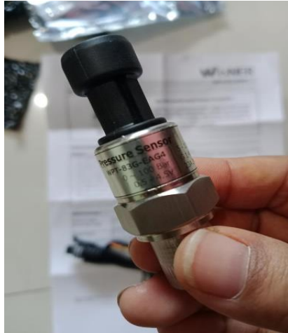
Gambar 9. Sensor Pressure Transmitter 100 Bar