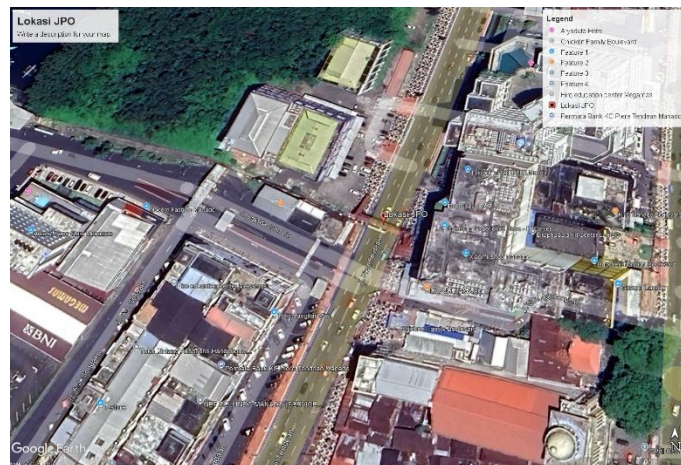
Gambar 1. Lokasi JPO

Subjek penelitian ini adalah pengguna Jembatan Penyeberangan Orang (JPO) di Jalan Pierre Tendean (Gambar 1), dengan jumlah sampel sebanyak 80 responden yang dipilih menggunakan teknik accidental sampling , yaitu penentuan sampel berdasarkan siapa saja yang secara kebetulan ditemui peneliti dan bersedia menjadi responden pada saat pelaksanaan survei. Teknik ini umum digunakan dalam penelitian lapangan pada fasilitas publik ketika populasi tidak dapat diidentifikasi secara pasti dan responden memiliki mobilitas tinggi (Sugiyono, 2016). Kriteria inklusi dalam penelitian ini meliputi pengguna JPO yang secara aktif melakukan aktivitas penyeberangan pada periode survei, sehingga data yang diperoleh mencerminkan perilaku dan persepsi pengguna aktual terhadap keberadaan dan fungsi JPO (Nazir, 2017).