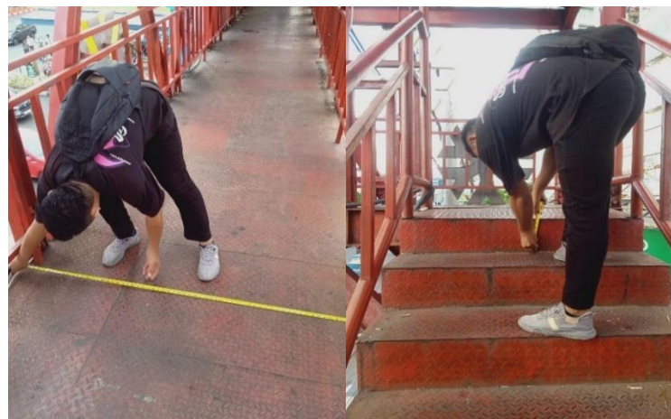
Gambar 3. Identifikasi Fisik JPO

Berdasarkan tabel 1 diatas, evaluasi kondisi eksisting Jembatan Penyeberangan Orang (JPO) terhadap persyaratan teknis yang ditetapkan oleh (Direktorat Jenderal Perhubungan Darat, 1997), mayoritas indikator menunjukkan kesesuaian dengan standar yang berlaku. Indikator kebebasan vertikal jembatan dan jalan raya, tinggi maksimum anak tangga, lebar anak tangga, panjang jalur turun, dan kelandaian semuanya memenuhi persyaratan, dengan selisih kecil yang masih berada dalam toleransi standar, sehingga dapat dikategorikan sesuai.